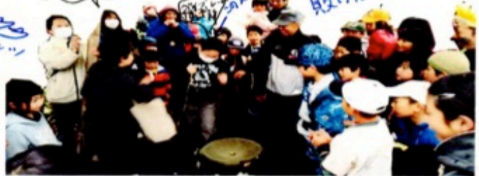
バーゴマチャンピオンシップで年度チャンピオンを決めるよ