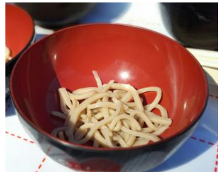
何杯でも食べたい美味しい蕎麦！