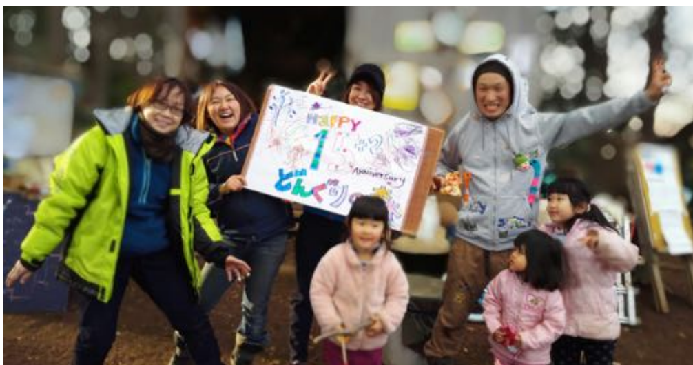
森の誕生日をお祝い！