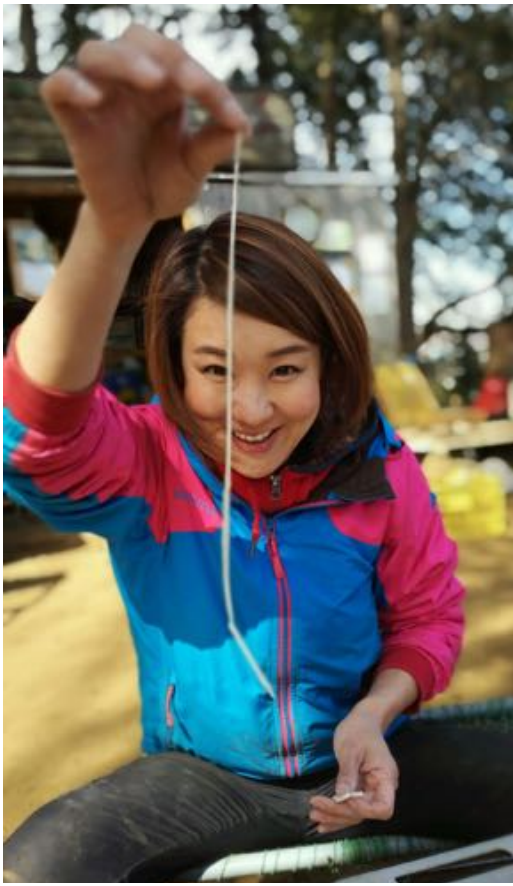
キレイナ〜イ！上手に蕎麦が打てたよ！