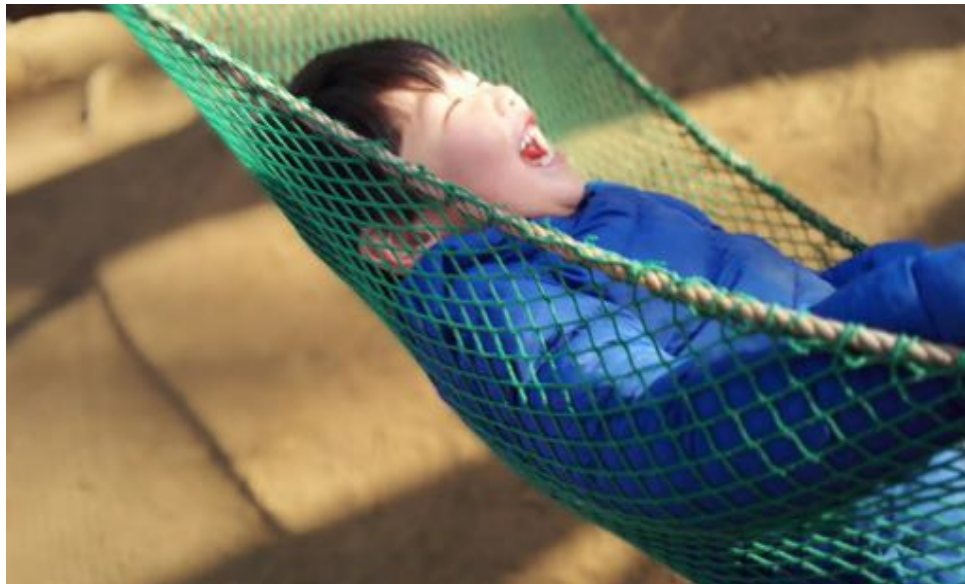
久しぶりのプレーパークが楽しくて！