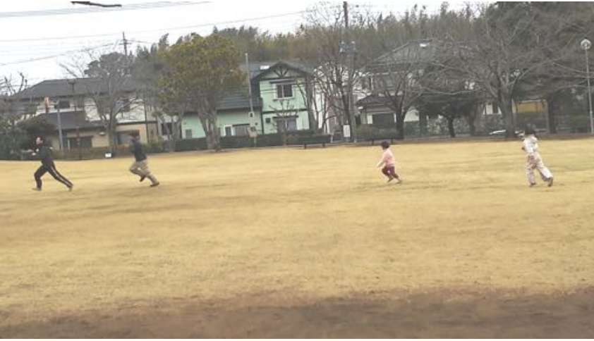
寒いから走り回る！