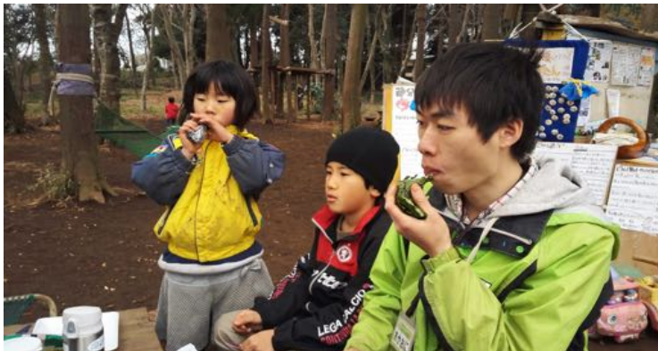
恵方巻きも作ったぞ！