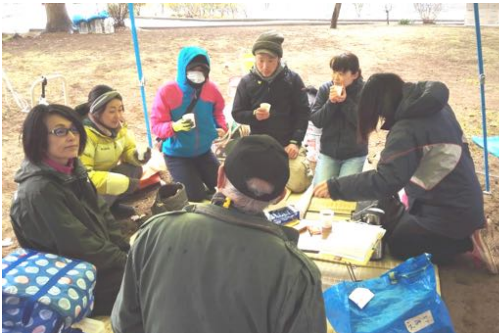
自治会長さんに今後のことについて相談を含め意見を頂きました！