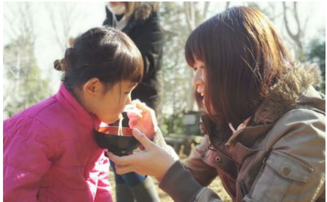
ママと作ったお蕎麦サイコー！