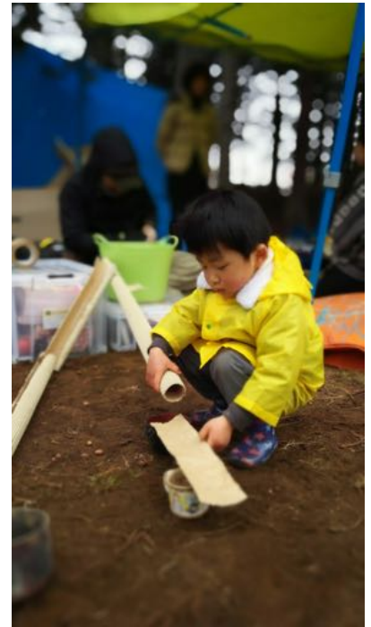
寒くてもひたすら遊ぶ！