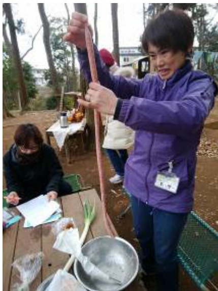
もっちーによる手作りソーセージ