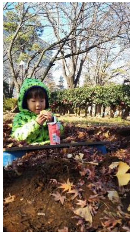
あったか〜い落ち葉のお布団（中央公園）