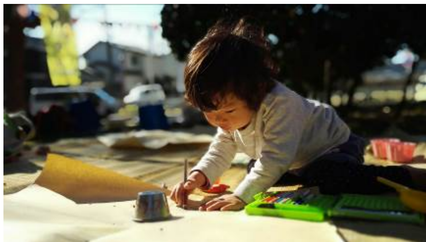
お絵かき楽しいね〜（中央公園）