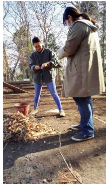
焚き火は大人も楽しい！