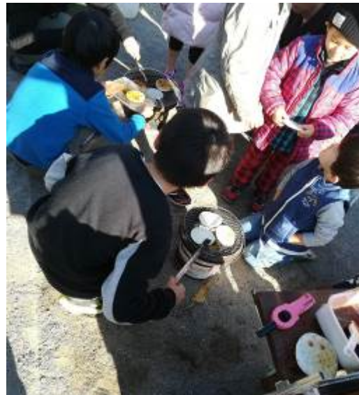
モンキーロープは大人も子どもも大好き！（都賀中広公園）お煎餅を焼くのも新鮮な体験！（都賀中広公園）