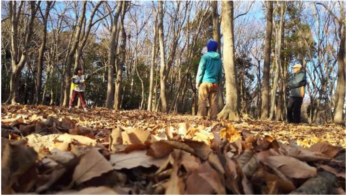
冬になるとふかふかの落ち葉でいっぱい