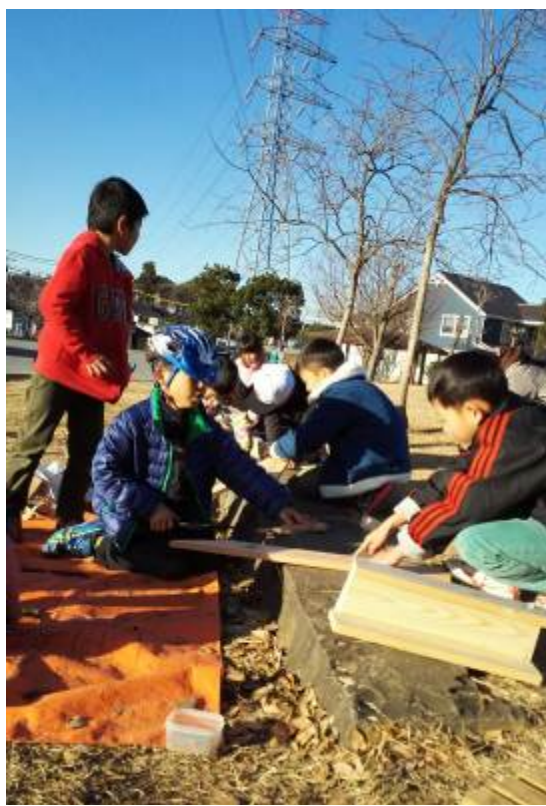
木工に夢中（さとくらし公園）