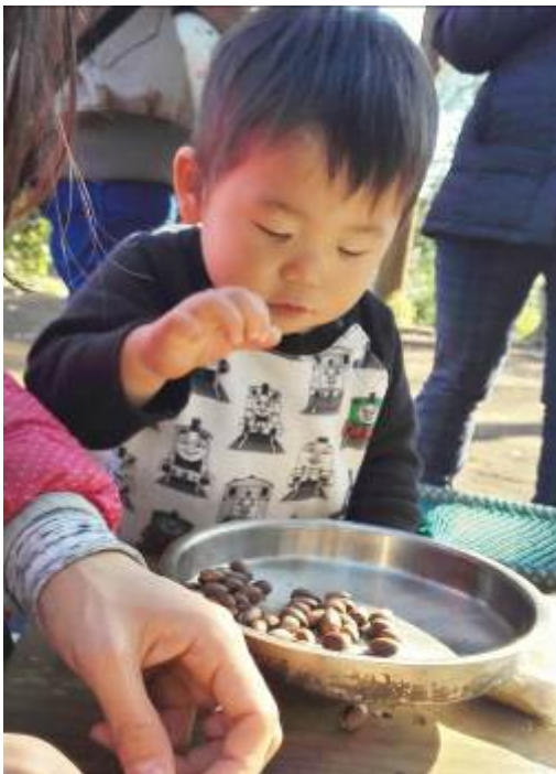
どんぐりを上手につまめるようになったね