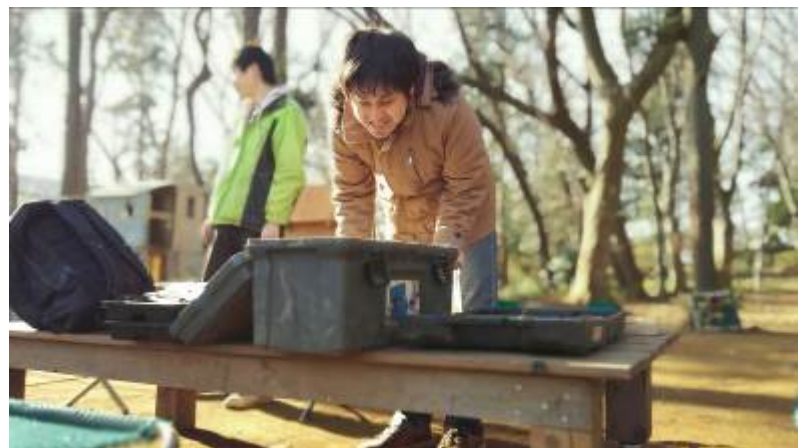
づっさんは何やら楽しいことに挑戦するらしい