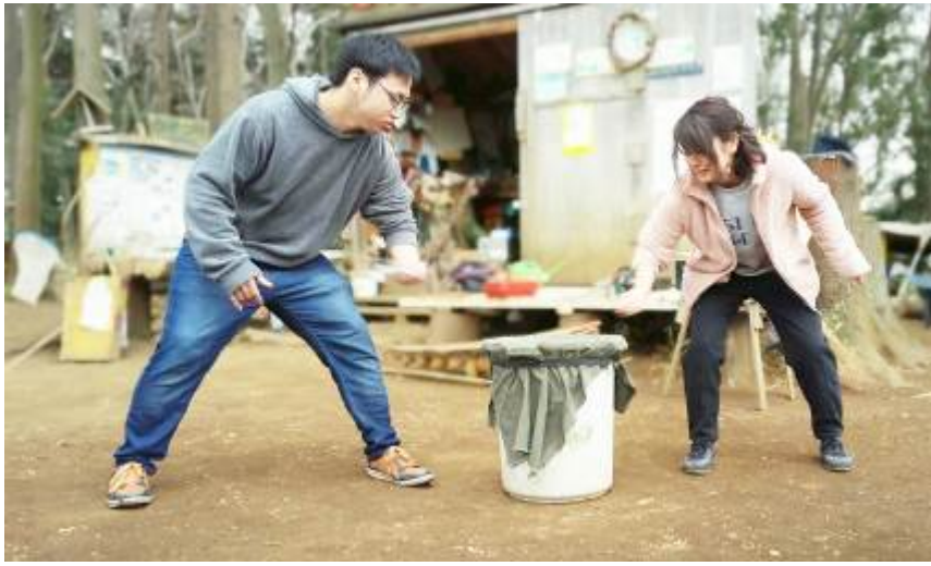
見よ！あっちゃんの雄姿を！！