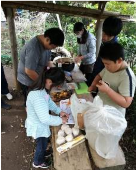
食べたい一心で材料を切る

みんなで材料を持ち寄って、切って、調理して……。1つの鍋から笑顔が溢れる11月。