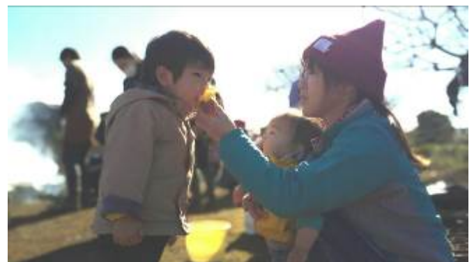
焼き芋を頬張って（大日プランプラン）