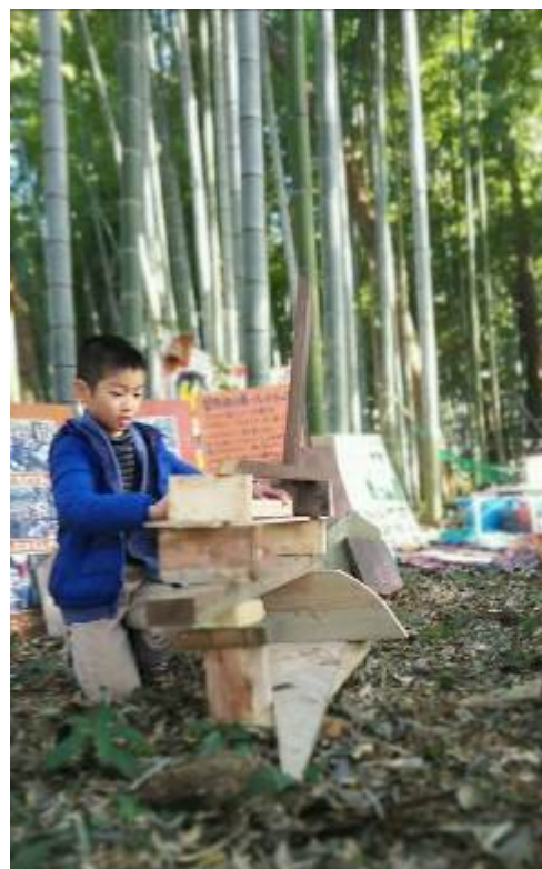
バランスが絶妙な積み木！