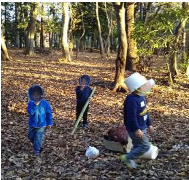
爆弾処理班ごっこ！（栗山ことりの森）