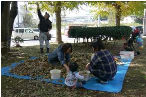
ふかふか落ち葉の感触がいいね！

大通りに面した場所で開催！通りから声をかけてもらったり、ぶらりと寄れるとってもいい場所！