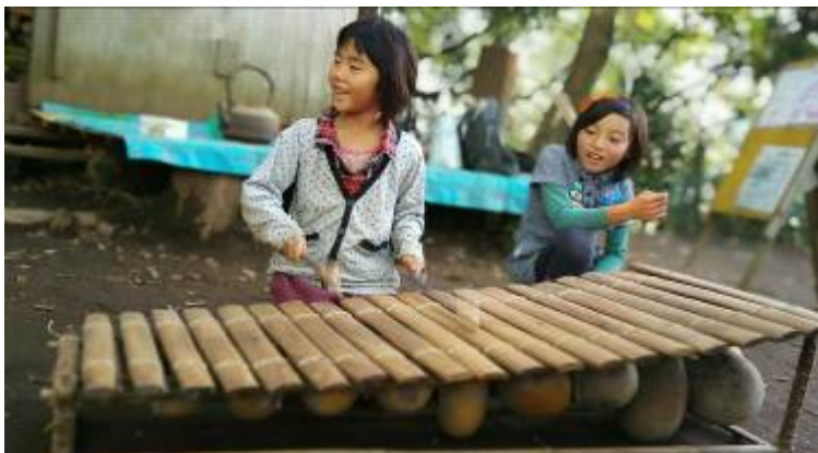
素敵な音が響くよ♪