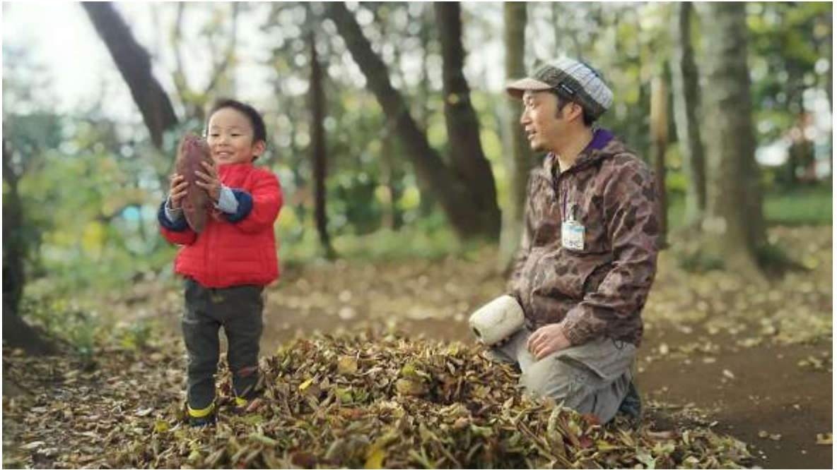
お宝ゲットだぜー！！落ち葉山の宝探し（もりのわ）