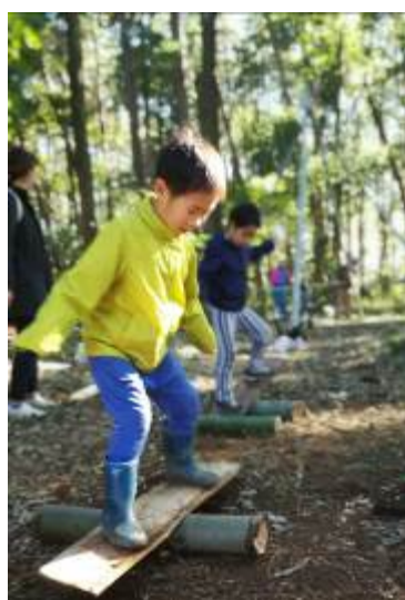
バランスバンブー！