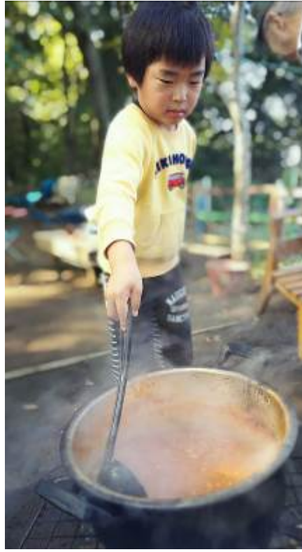
絶品ミートソース！