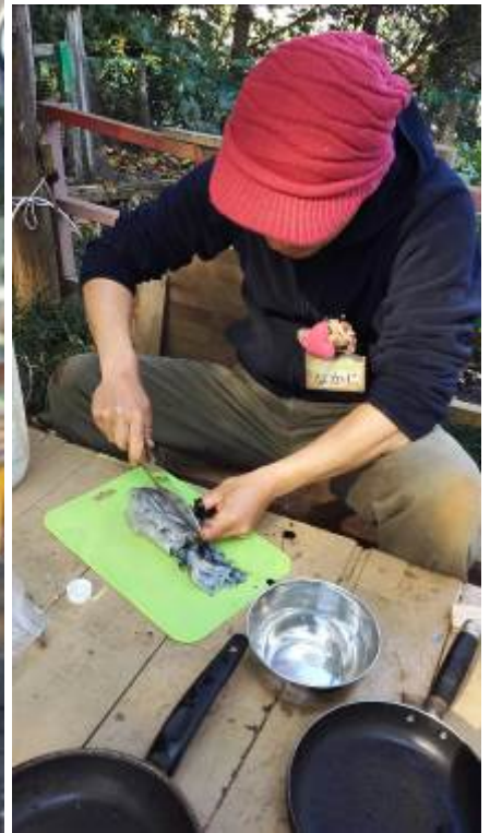
釣ったアオリイカを捌く！