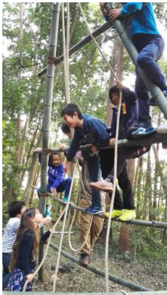
豊富な竹でジャングルジムを作ったよ！