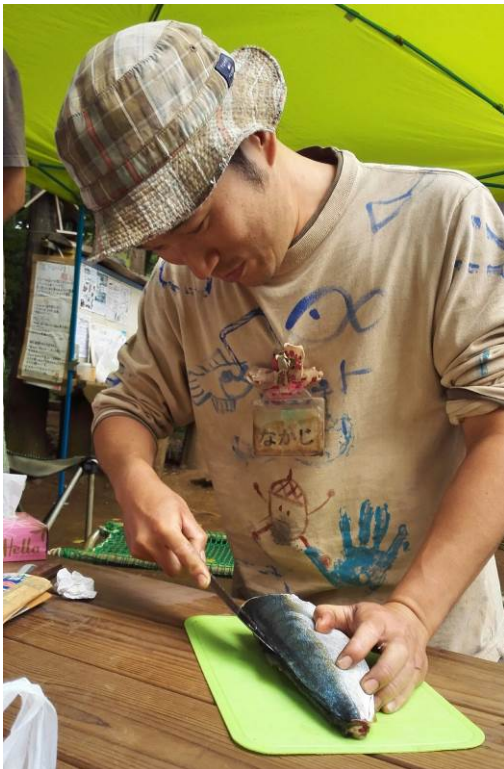
魚のさばき方教えますよ！