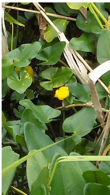
コウホネ咲いていた！