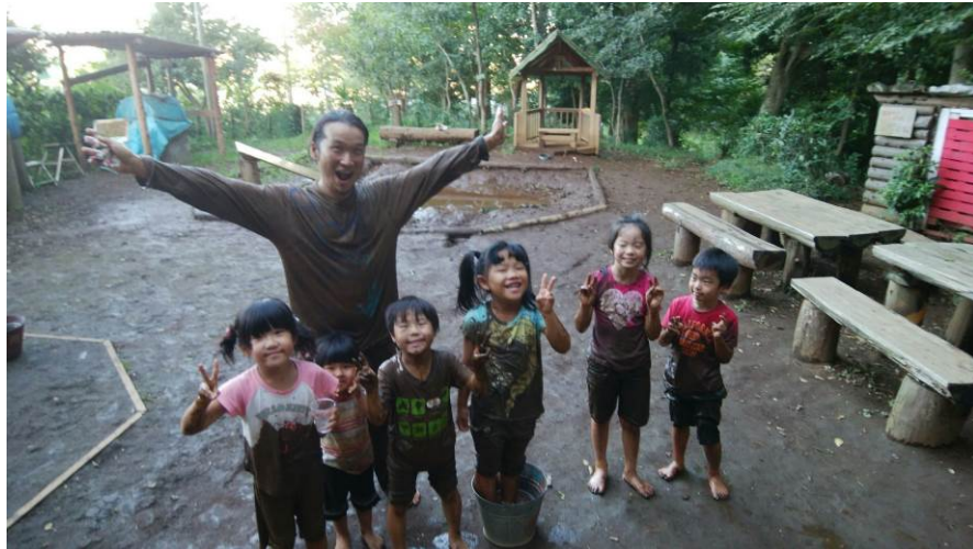
今シーズン最後か？泥軍団！