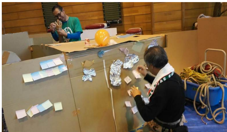
段ボールは発想の源！「こどものまち」