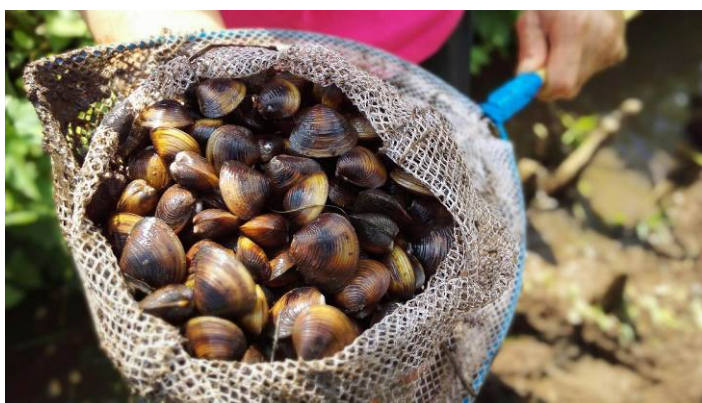
シジミがどっさり！