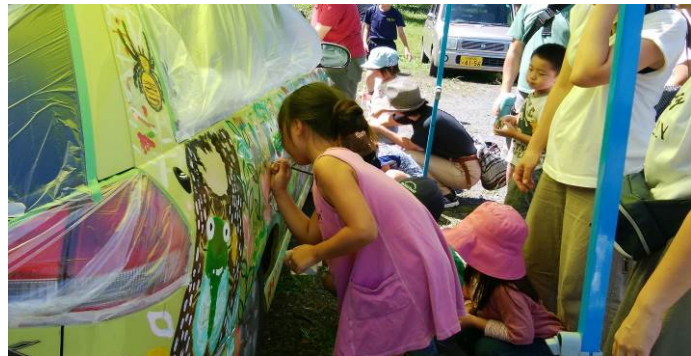
皆でプレーカーにペイント！感謝です！