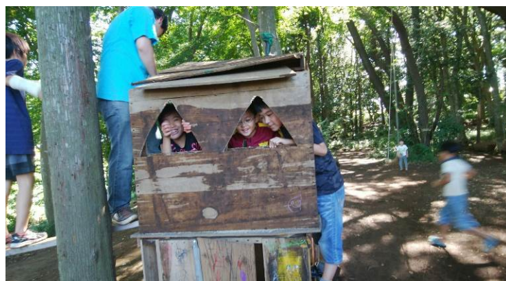
パレットハウスが2階建てになりました！