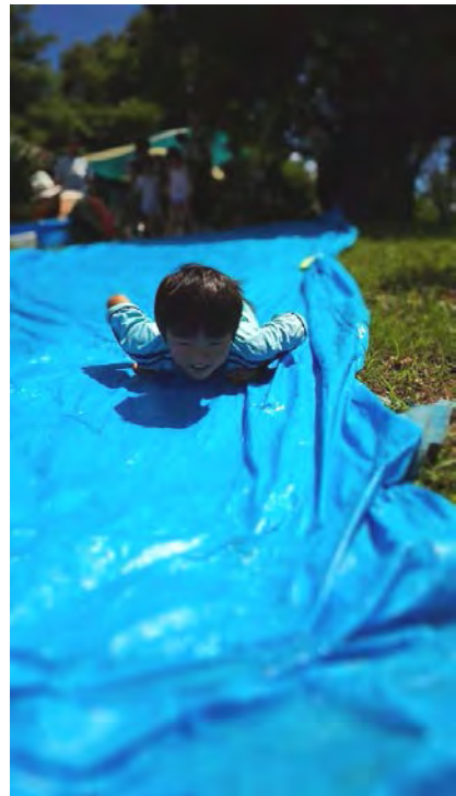
夏はウォータースライダーで決まり！（鷹の台）