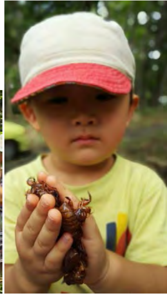
台風の落とし物ですよ～