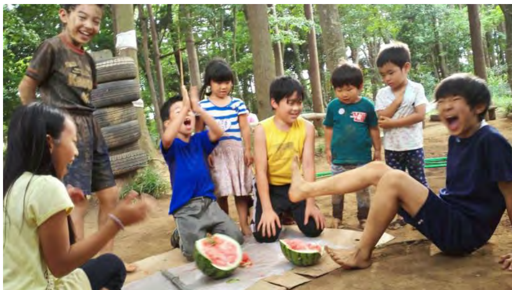
夏の終わりはスイカ割りでけじめをつける