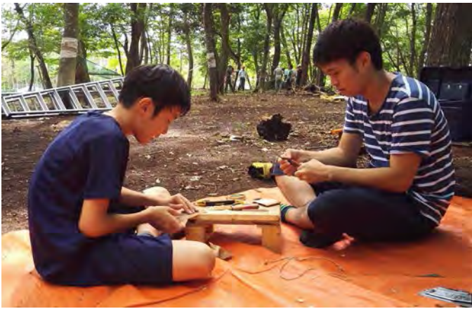
真剣です！木のベーゴマ作り