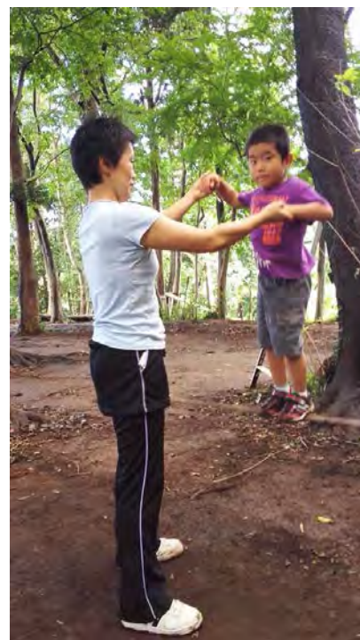
何回飛べる？スラックライン大会