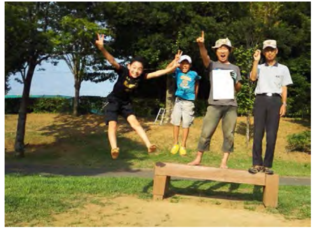
ベーゴマ大会楽しいよ！（もねのさと出張）